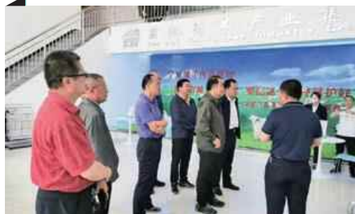
P22 民进宁夏区委会调研我区草原生态保护工作