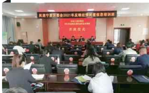
P14 民进宁夏区委会举办2021年反映社情民意信息培训班