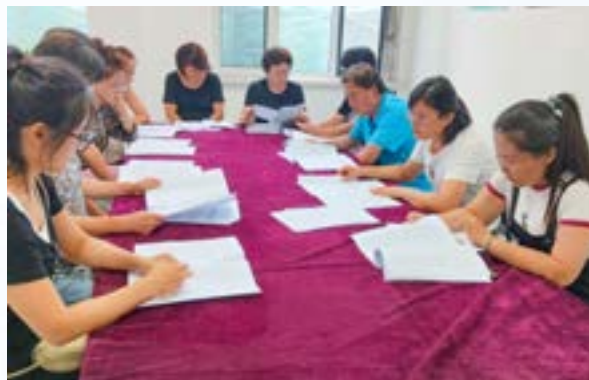
总支召开中共二十届四中全会精神学习会

环节，每月主题活动固定15-20分钟学习时段，每季度开展专题集中学习，形成“常态学、持续学”的良好氛围。搭建线上线下学习阵地，微信工作群年均推送学习内容200余条，年均收集各类学习体会30余篇，推动理论学习从“被动听”向“主动悟”转变。完善组织保障体系，明确总支委员会统筹协调、各支部协同落实、骨干会员带头示范的责任链条。健全考核激励机制，将学习成效、思想表现与参政议政、社会服务实绩同步纳入会员履职评价，积极向当地党委统战部推荐人才，支持会员评优评先。