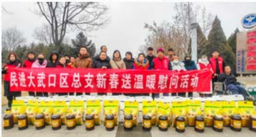
总支开展新春送温暖活动

农村地区因父母双方重病、重残、服刑、强制隔离戒毒等特殊情形，事实无人抚养儿童群体规模持续扩大。现行关爱保护体系仍存在政策执行力度薄弱、救助资金存在挪用风险、心理健康保障严重缺位、优质教育资源匮乏等问题。建议：一是建立多部门联合核查机制，同步细化资格认定细则，推行“儿童账户+定向支付”模式，构建全链条保障闭环体系。二是强化职能部门协同，通过记录在校表现、建立心理健康档案、上门心理疏导等方式，全方位筑牢心理健康防线。三是搭建“政府+社会+市场”多元资源整合帮扶平台，建立透明化资金使用监管机制，通过“微心愿”圆梦行动等方式提供精准帮扶，切实为困境儿童成长赋能。