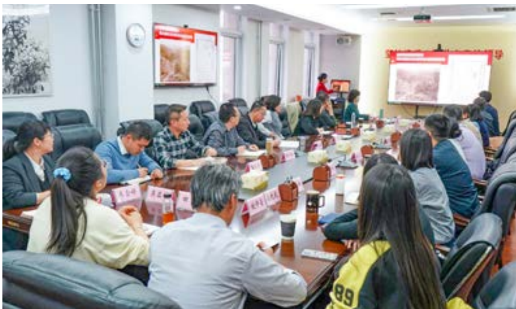
3月25日，民进宁夏区委会邀请宁夏博物馆专业讲解员送展上门，为机关干部和会员代表带来一堂生动的红色家风教育课

会议传达学习全区警示教育大会精神，组织机关处级以上干部集中观看警示教育片《权欲之祸》，认真研读《忏悔警示录》，通过典型案例深度剖析，深刻揭示权力观扭曲、政绩观错位的严重危害，让大家真切感受到“贪廉一念间，荣辱两重天”的深刻教训。结合典型案例，区委会领导班子与机关各处室负责人进行集体廉政谈话教育，引导大家始终绷紧廉洁自律这根弦，将“看在眼里